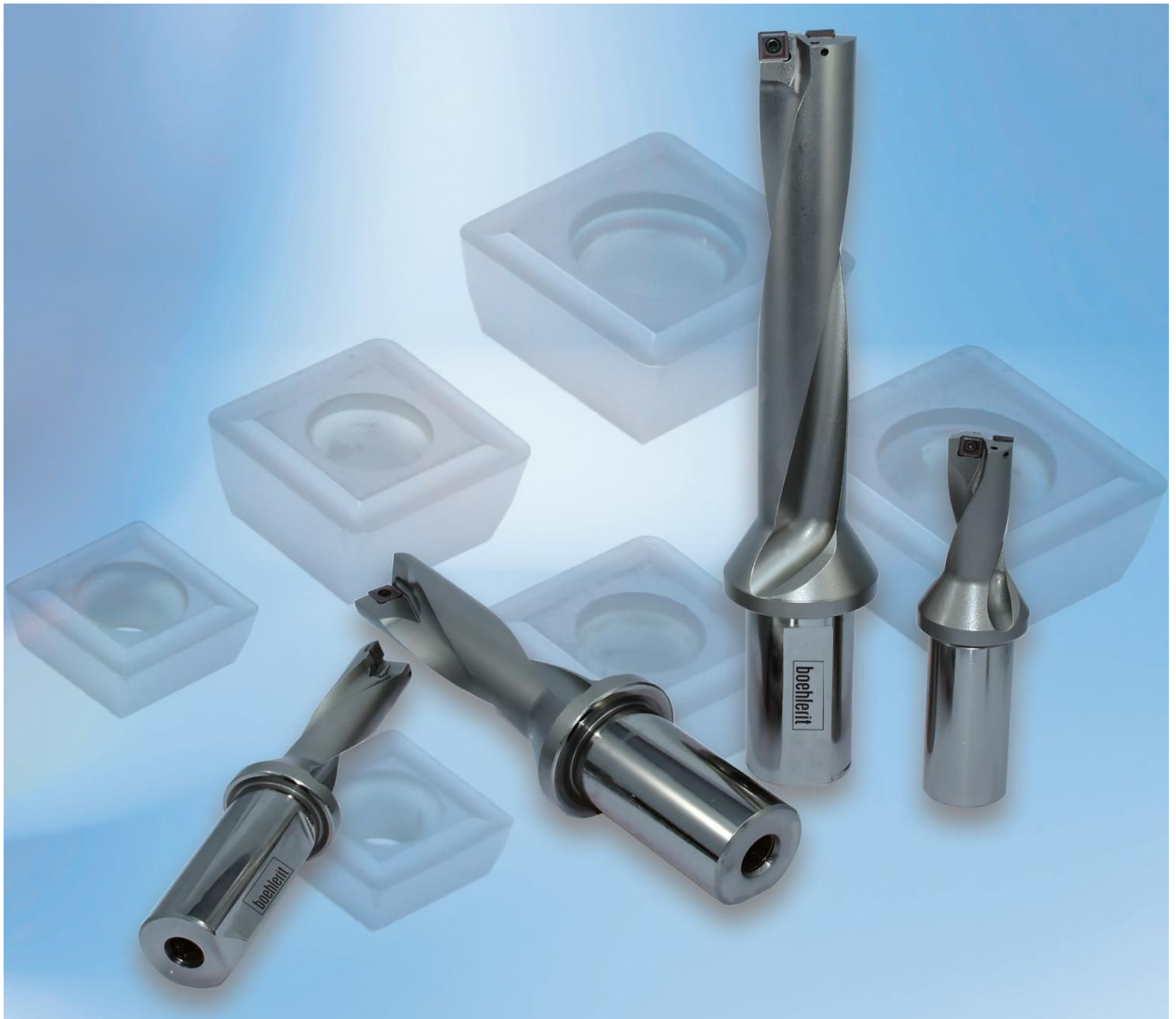
Abb. 1: Der neue Drilltec Wendeplattenbohrer von Boehlerit überzeugt durch hohe Schnitt- und Vorschubgeschwindigkeiten, ein hohes Zerspanungsvolumen und eine herausragende Bohrqualität.