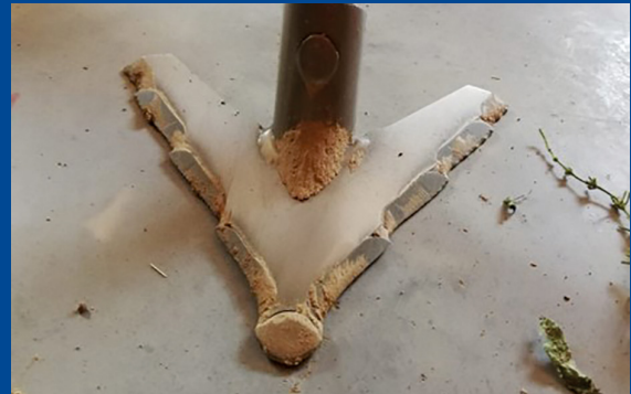
HS180A1, 12-reihig nach etwa 350 ha