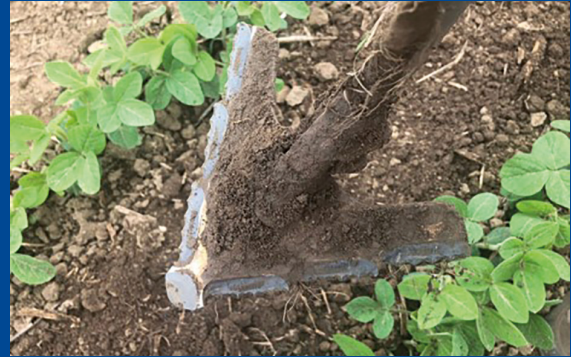
HS160A2, nach etwa 100 ha Sägezahnform noch gut erkennbar