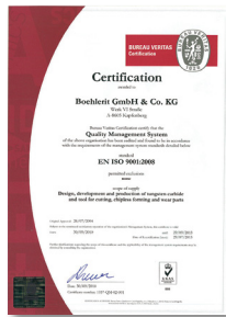
Zertifikat EN ISO 9001:2008 Certificate EN ISO 9001:2008