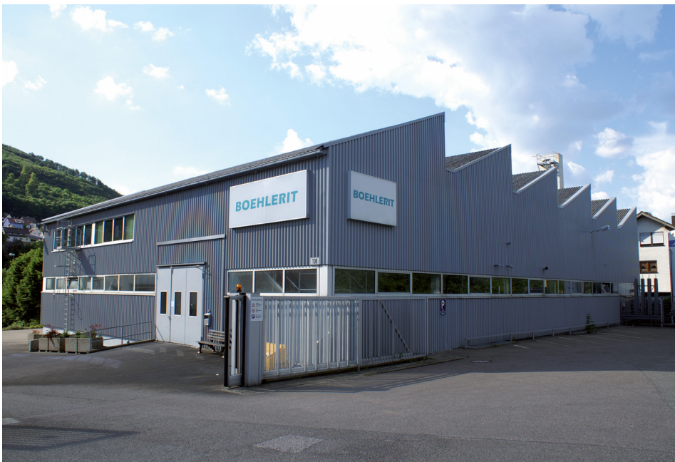
Oberkochen in Deutschland / Oberkochen in Germany

The Boehlerit brand was established in 1932 for the hard metal production of the Böhler company in Dusseldorf. 1950 was the beginning of carbide production in the Austrian steel town of Kapfenberg where the Boehlerit Group's headquarters are located today. The take-over of the entire Boehlerit Group by the Leitz Group from Oberkochen, Germany in 1991 marked an important milestone in the history of Boehlerit. Since its integration into the Leitz Group, Boehlerit has successfully developed into the group's centre for cutting materials. It is one of the world's leading producers of carbide cutting materials for tools for wood, plastic and metal cutting and tools for turning, milling, drilling and bar peeling. Hard metals for structural parts and wear protection are yet another core competency of Boehlerit. In 1998 a further carbide production for saw tips and tailor made parts in a rapid production line was established.