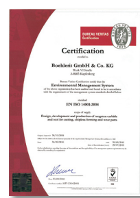
Zertifikat EN ISO 14001:2004 Certificate EN ISO 14001:2004